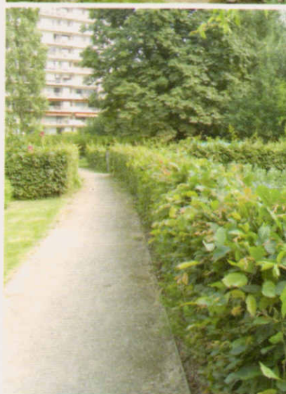
Haies et sentiers forment la structure des petits jardins d'ouvrier dans le parc du Onze novembre. C'est leur aménagement individuel qui fait le charme de cette zone verte.